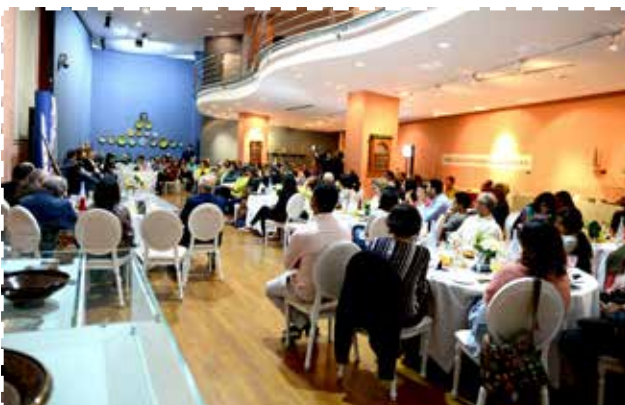
Présentation du Livre « Soufisme et Coaching. Rencontres d'ici et d'ailleurs » en 2018