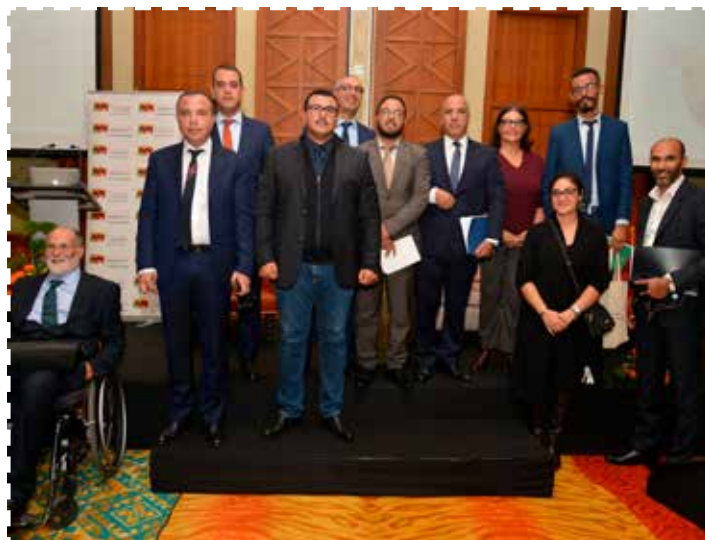
Conférence « Les nouvelles opportunités économiques d'El Jadida » en 2018