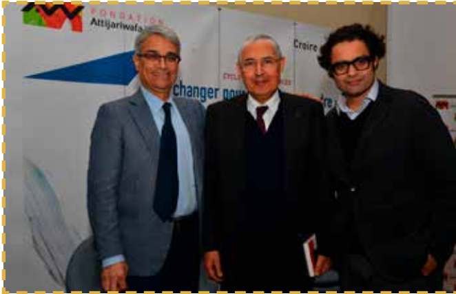
Conférence « La jeunesse marocaine face aux défis de l'addiction » en 2018