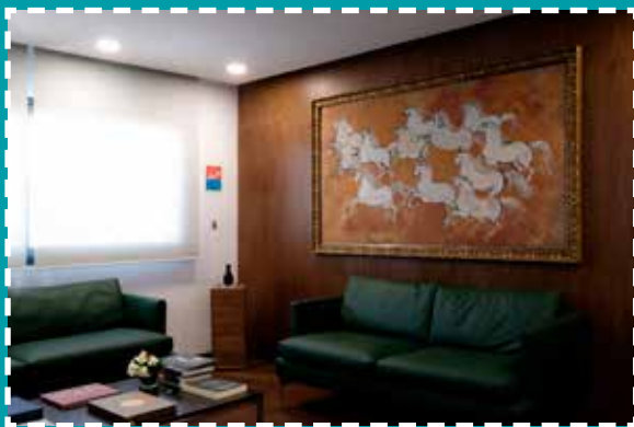
Oeuvre de Hassan El Glaoui au siège régional de Rabat Souissi