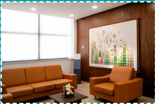
Oeuvre de Hussein Miloudi au siège régional de Rabat Souissi