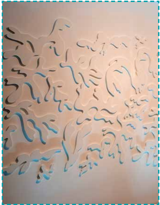
Frise murale de l'artiste Malika Agueznay au siège régional de Rabat Souissi

La Fondation participe en continu à la valorisation de la collection du groupe Attijariwafa bank à travers la production d'écrits, la recherche documentaire, la conservation préventive et l'intégration d'œuvres dans tous les espaces de travail de la banque, afin de permettre une meilleure compréhension du patrimoine pictural en interne.