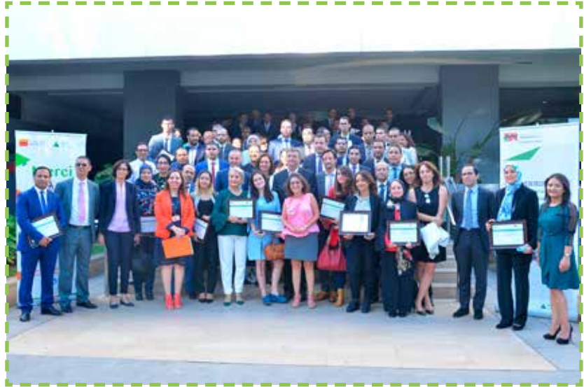
Collaborateurs bénévoles auprès de l'association INJAZ Al-Maghrib en 2018